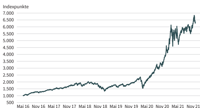
Grafik 1: Wertentwicklung des Solactive Metaverse Select Index CNTR Indexauflage am 22. November 2021 (Basislevel 1.000 Indexpunkte am 9. Mai 2016)

Stand: 30. November 2021; Quelle: Bloomberg FRÜHERE WERTENTWICKLUNGEN UND SIMULATIONEN SIND KEIN INDIKATOR FÜR DIE KÜNFTIGE WERTENTWICKLUNG. DIE RENDITE KANN INFOLGE VON WÄHRUNGSSCHWANKUNGEN STEIGEN ODER FALLEN. DIE GRAFIK BEINHÄLTET DATEN, DIE AUF EINEM BACKTESTING BASIEREN, DAS HEIßT BERECHNUNGEN, WIE SICH DER INDEX VOR INDEXAUFLAGE ENTWICKELT HABEN KÖNNTE, WENN ER UNTER VERWENDUNG DERSELBEN INDEXMETHODE UND BASIEREND AUF HISTORISCHEN BESTANDTEILEN EXISTIERT HÄTTE.