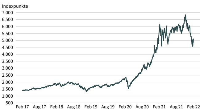
Grafik 1: Wertentwicklung des Solactive Metaverse Select Index CNTR Indexauflage am 22. November 2021 (Basislevel 1.000 Indexpunkte am 9. Mai 2016)

Stand: 9. Februar 2022; Quelle: Bloomberg